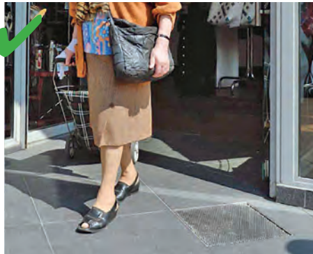
☺ Exemple d'une entrée de magasin plain-pied.