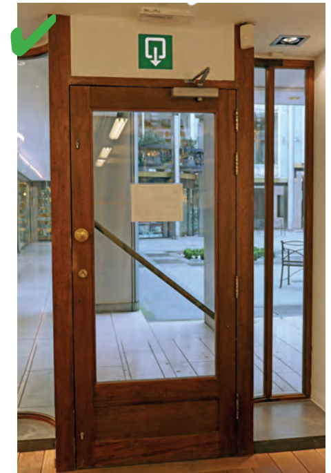
☺ Une issue de secours est prévue. La porte mesure 0,90 m de large, ce qui permet à une personne en fauteuil d'évacuer.