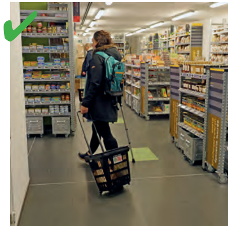
☺ Les allées sont suffisamment larges pour que les clients puissent se croiser. Ici une personne est équipée d'une béquille et d'un caddie mais peut tout de même circuler sans souci. De plus, il n'y a aucun obstacle au sol.