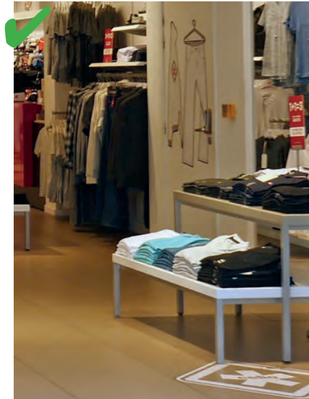
☺ Les présentoirs permettent d'attraper les produits entre 0,50 m et 1,30 m du sol.