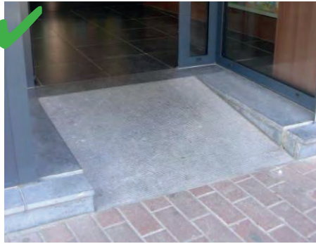
☺ La marche a été rattrapée vers l'intérieur par une pente douce.